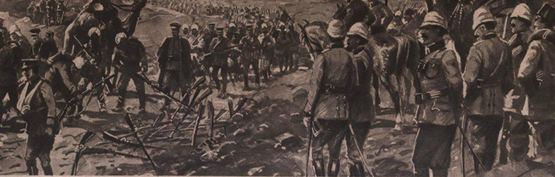
Die bedingungslose Kapitulation der englischen von General Townshend kommandierten Armee bei Kut-el-Amara: Nach Übergabe des Platzes an die siegreichen türkischen Belagerer, werden die 13.300 Mann starken Truppen, darunter fünf Generale, 377 englische und 214 indische Offiziere unter Ablegung der Waffen in Kriegsgefangenschaft geführt. Nach einer Originalzeichnung von Kenneth MacDonald.

Bu çarpışmaların askeri tarih açısından bir başka önemi de bilinen ilk havadan ikmal denemesini İngiliz ordusunun Kut'taki birliklerini ikmal için 26 gün boyunca Dicle 'deki Ora Üssü'nden 3 adet Short 184 tipi 225 beygirlik deniz uçakları ile bu kuşatma sırasında gerçekleştirmiş olmalarıdır.