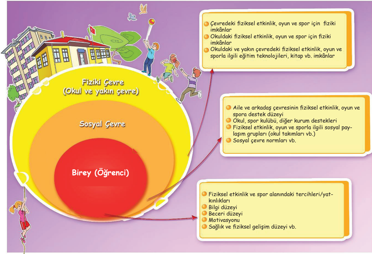
Şekil 1. Okula özgü düzenlemelerde incelenmesi gereken temel unsurlar

Bu Program'daki çıktılara ulaşmak için öğretmenler, öğrencilerin bireysel özellikleri ile sosyal ve fiziksel çevrelerinin özellikleri doğrultusunda uyarlamalar yapmalıdırlar. Örneğin öğretmenler etkinlik seçimi ve uygulamalarında okul çevresinin sosyal, kültürel durumu, veli beklentileri ve hassasiyetleri dikkate alınarak modern danslar yerine halk danslarına yer verebilirler. Bu amaçla eğitim öğretim yılı başında öğretmenlerin Şekil 1'de belirtilen her bir boyutu gözden geçirerek düzenlemeler yapmaları önerilir.