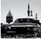
Mevlâna Türbesi Konya