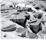
Pamukkale Travertenleri Denizli