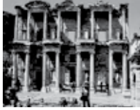
Efes Harabeleri İzmir

Görsellerde verilen tarihî ve doğal varlıkları koruma ve tanıtma, aşağıdaki bakanlıklar- dan hangisinin görev ve sorumluluk alanı- na girer?