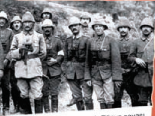
1. Dünya savaşı

Cumhuriyet'te egemenlik kayıtsız şartsız milletindir. Millet kendini yönetme yetkisini milletvekilleri aracılığı ile kullanır. Cumhuriyet yönetiminde yurttaşın seçme ve seçilme hakkı vardır. Seçilen temsilciler yasalar yapar, yöneticileri milleti adına denetler. Halk dilerse, seçimlerde yöneticilerini değiştirirler.