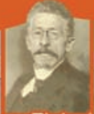
Căsar Flaischlen (Sizir Filaşlen)

Güneşin olsun gönlünde Kar bile yağsa, ya da fırtına olsa Gök bulutlarla ve dünya kavgayla dolsa Güneşin olsun gönlünde O zaman gelsin ne gelirse Doldurur ışıklarla en karanlık gününü Bir şarkın olsun dudaklarında Sevinçli ezgilerle Seni günlük tasalar bunalıma boğsa bile Bir şarkın olsun dudaklarında O zaman gelsin ne gelirse Yardım eder savuşturmaya en yalnız gününü Başkaları için de bir diyeceğin olsun Tasada ve bunalımda Ve kendi ruhunu şenlendirecek her şeyi Söyle onlara da, bir şarkın olsun dudaklarında Yitirme sakın yürekliliğini Güneşin olsun gönlünde Ve her şey iyi olacak